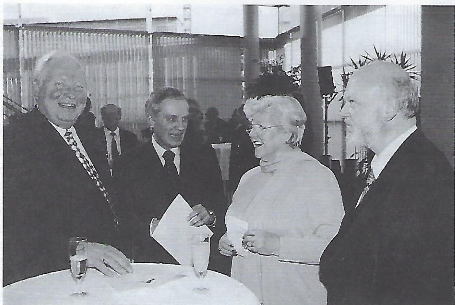
Die Stadt war mit Oberbürgermeister Scholz und Bürgermeisterin Jungkunz vertreten.