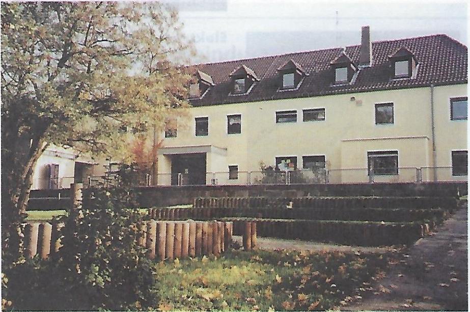
Das Loni-Übler-Haus an der MarthasträÙe - ein fester Bestandteil des kulturellen Lebens in Mөгeldorf. Näheres Seite 3

Mitteilungen des Bürger- und Geschichtsvereins Mөгeldorf e. V. Heft 1 Februar 1999 47. Jahrgang