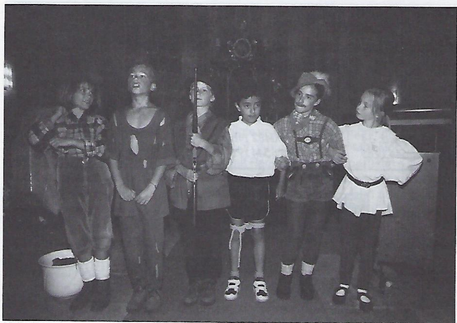
Diese „Sechs kommen durch die Welt“