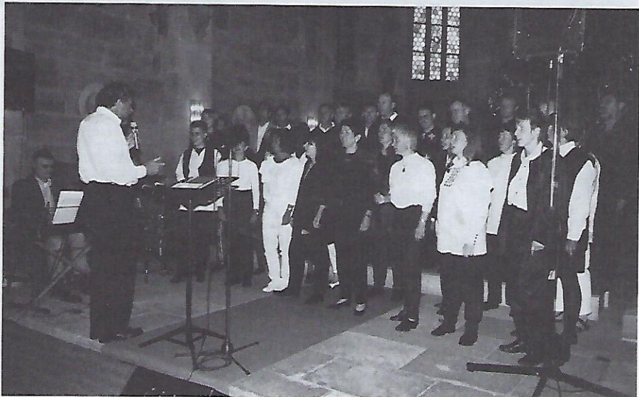
Der „Nürnberger Gospelchor“ eröffnet mit temperamentvollen Liedern das Schloßfest.