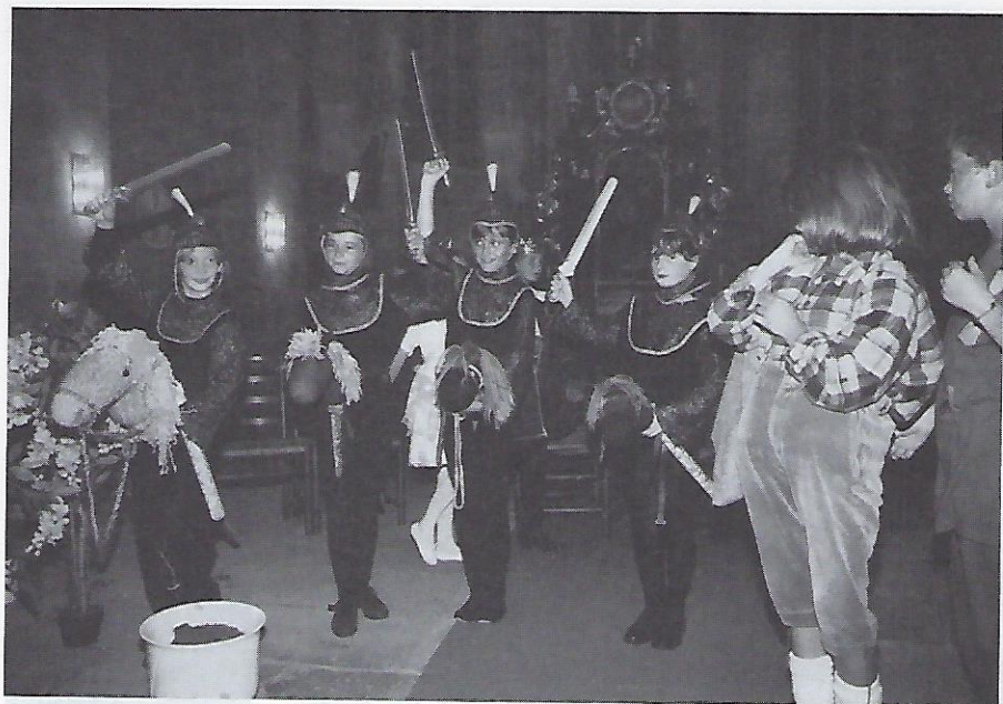
Die Spielschar der Thusneldaschule – Aufmarsch der Soldaten