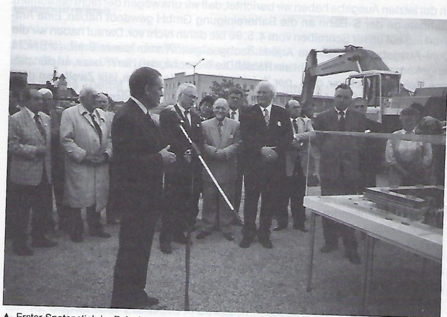
▲ Erster Spatenstich im Beisein prominenter Gäste