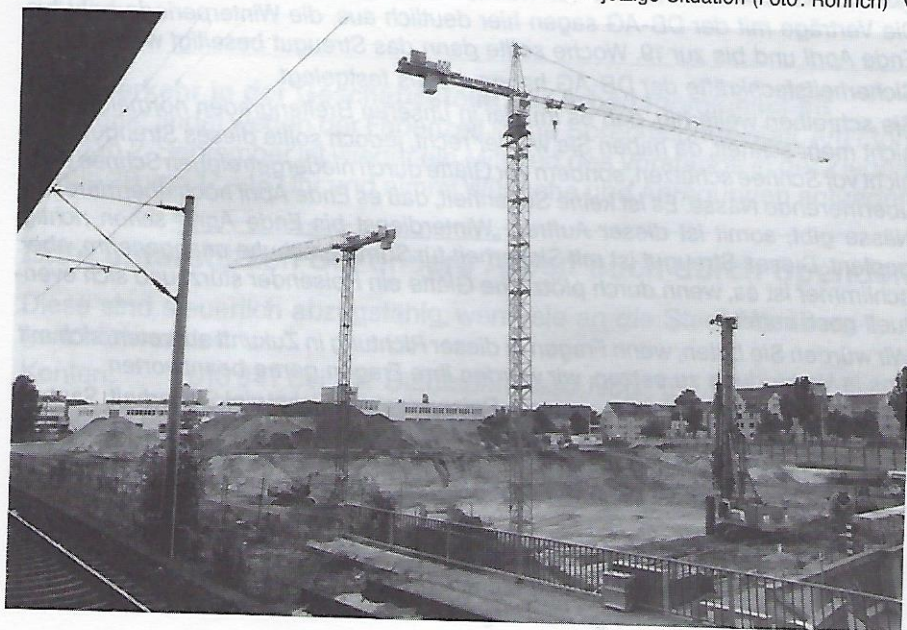
Die jetzige Situation ▼