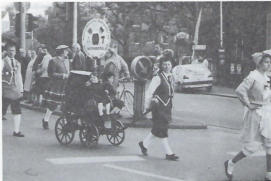
Klein aber fein: Ein Wagen des „Vereins historischer Büttentanz“.