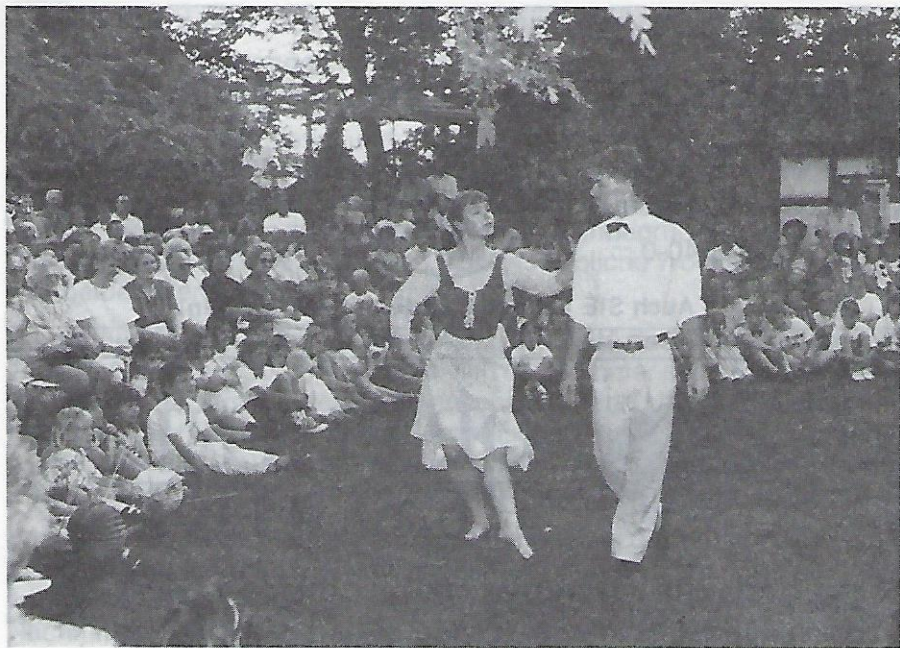
Ein fester Bestandteil im Programm: das klassische Ballett.