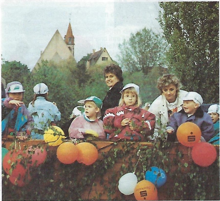
Beim Kirchweihzug 1991 waren alle Generationen vertreten – hier die Kinder der Handballabteilung des Sportbundes Morgenrot.