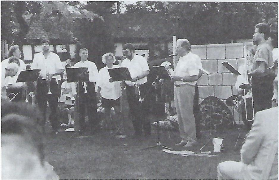
Der 1. Vorsitzende, umrahmt von den Bläsern des Mögelderfer Posaunenchors, begrüßt die zahlreichen Besucher.