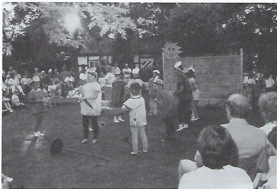
Die Kinder der Klasse 3a der Billrothschule bei ihrem temperamentvollen Spiel.