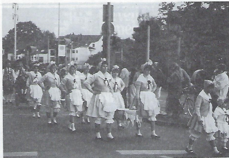
Die stramme Garde der „Nürnberger Wäschermdla“