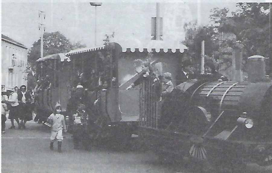
Die große Überraschung des Jahres: die historische „Adler-Eisenbahn“ – gestaltet von der Bundesbahn-Landwirtschaft.