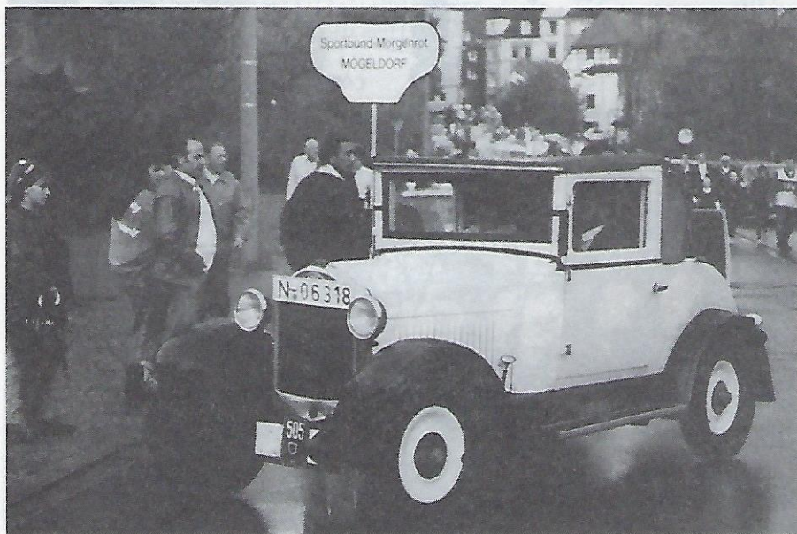
Ein im letzten Augenblick importierter „Old-timer“ aus der ehemaligen DDR.