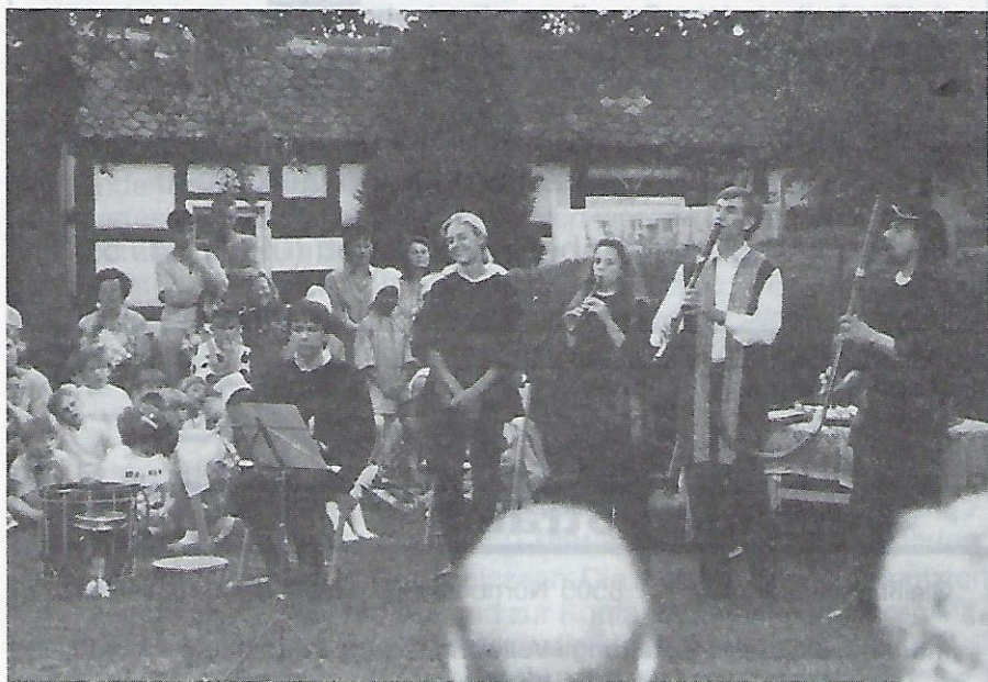
Die „Capella antiqua bambergensis“ erfreute wieder durch ihre Weisen mit alten Instrumenten.