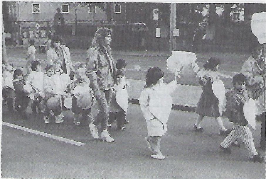
Auch der Kindergarten Mögeldorf zog tapfer mit.