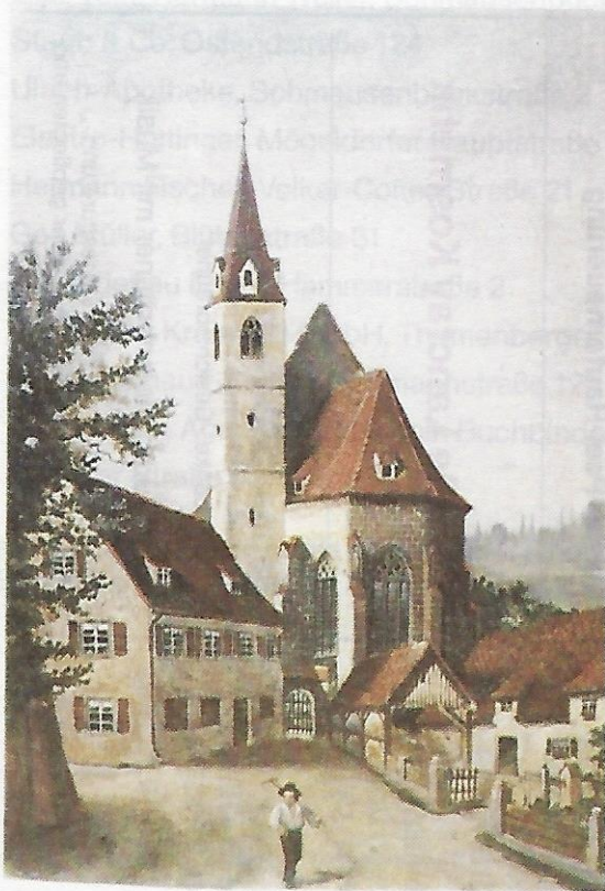
Die Mögeldorfer Kirche mit dem Schulhaus (li.) und dem Gechterbauernhof (re.). Gemälde aus dem Jahre 1885 von dem Lehrer in Mögeldorf, Hans Feist.