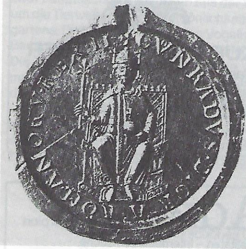
Konrad II. Zeitgenössisches Siegel.