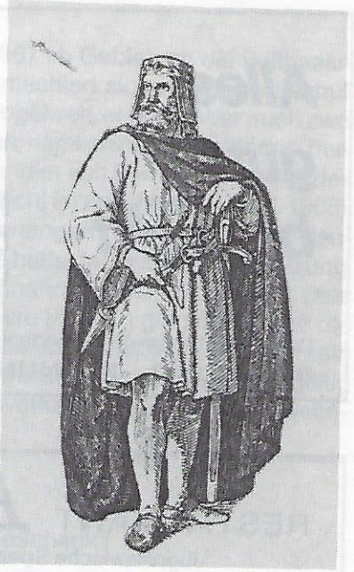
Konrad der Zweite. 1024 – 1039.