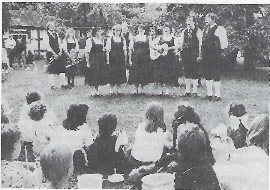
Bad Windsheimer Spielleut und Sänger.