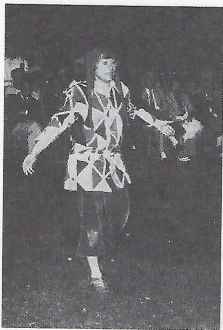
Till Eulenspiegel in Aktion.