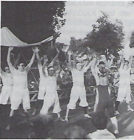
Höhepunkt der Darbietungen war Aerobic durch einige freiwillige Männer unter fachmännischer weiblicher Leitung.