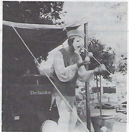
Der Gaukler von Ebensee mühte sich ehrlich, mit einigen Bällen zu jonglieren.