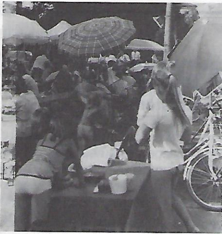
Der kleine Trepelmarkt der Kinder