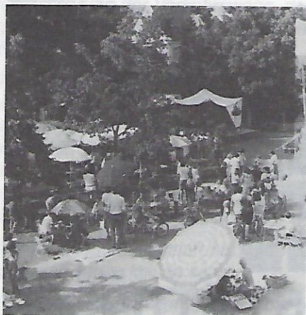
Die „Feststraße“ mit dem Musikzelt im Hintergrund.