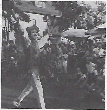
Der „Gaukler von Ebensee“