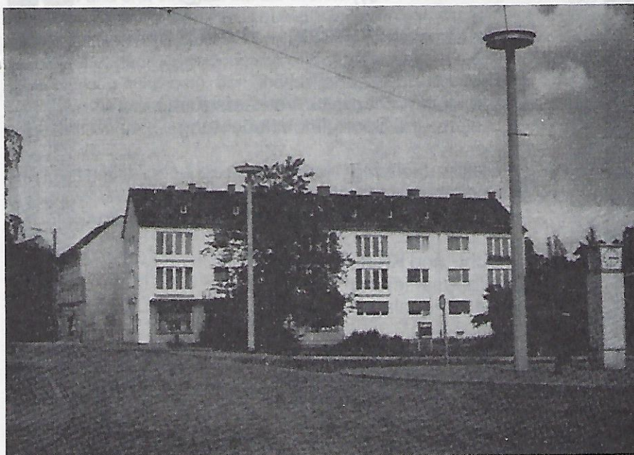
Die Gestaltung des Platzes, auf dem die ehemalige Gaststätte Tretter, zuletzt Gutmann stand, der „Mögeldorfer Plärrer“.