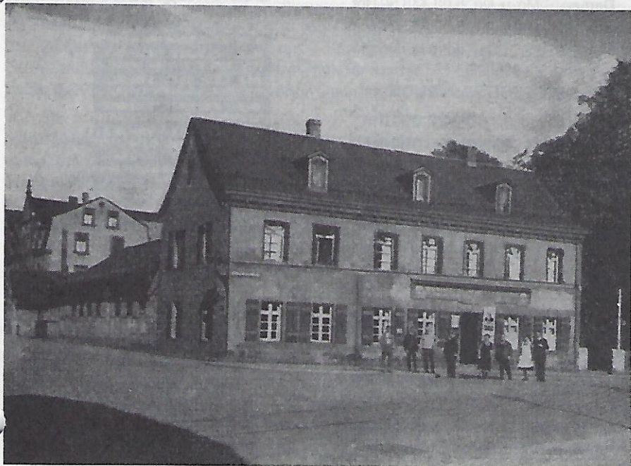
Ehemalige Gaststätte Gutmann, Schmausenbuckstraße 9, im 2. Weltkrieg zerstört, nicht wieder aufgebaut.