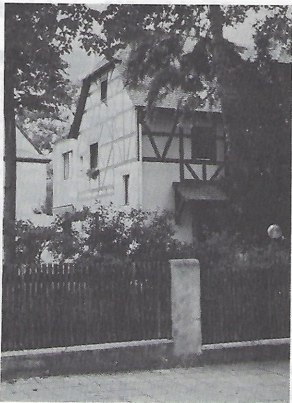
Dieses Haus (Ecke Blumenröderstraße und Schilfstraße) ist das älteste Haus des Ortsteils Ebensee (erbaut 1899).

alten Wegbezeichnungen bei. Lediglich soweit Straßen in Nürnberg den gleichen Namen hatten, erfolgte eine Umbenennung. So wurde aus der Brückenstr. die Flußstr., aus der Bahnhofstr. die Freiligrathstr. und aus dem Stadtweg die Ostendstraße.