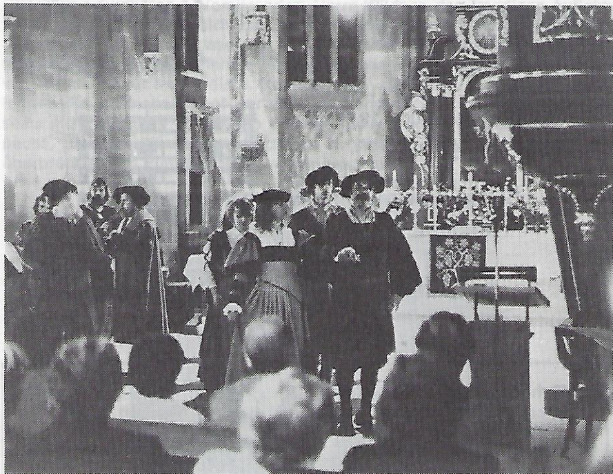
Schloßfest 1981 — Schembart-Tänzer