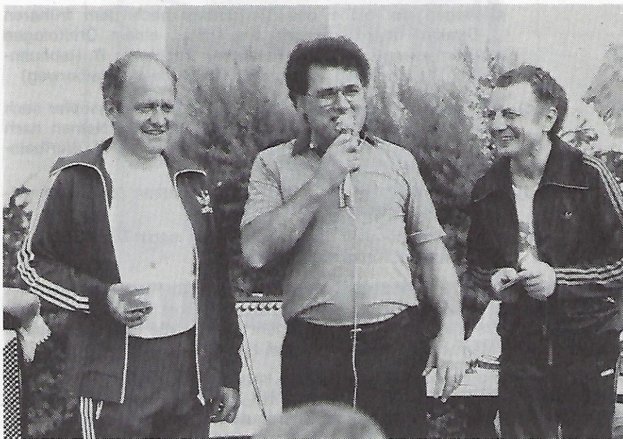
Die Geistlichkeit „beider Fakultäten im Partner-Look“.

Das Gemeindefest am Sonntag, dem 5. Juli 1981 war ein voller Erfolg! Wie gelungen es war, und welche gute Stimmung herrschte, zeigen die Schnappschüsse von Herrn Ulrich.