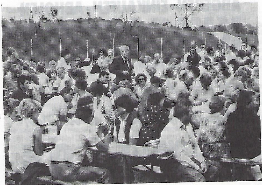
„Fröhlich vereint im Gespräch“