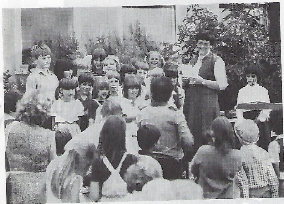
„Auch die Jugend ist aktiv“