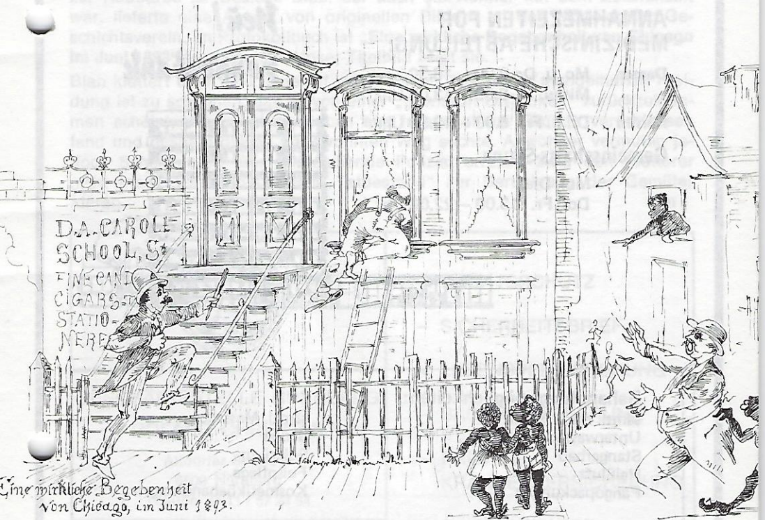
Eine wichtige Begebenheit von Chicago, im Juni 1893.