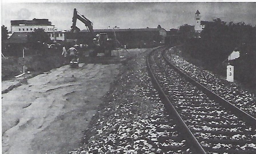
Gleisaufschüttung eines Bahnkörpers für das Ausweichgleis

Ein weiteres Bild von der zur Zeit ruhenden größten Straßenbaustelle Mögeldorf (Ring)