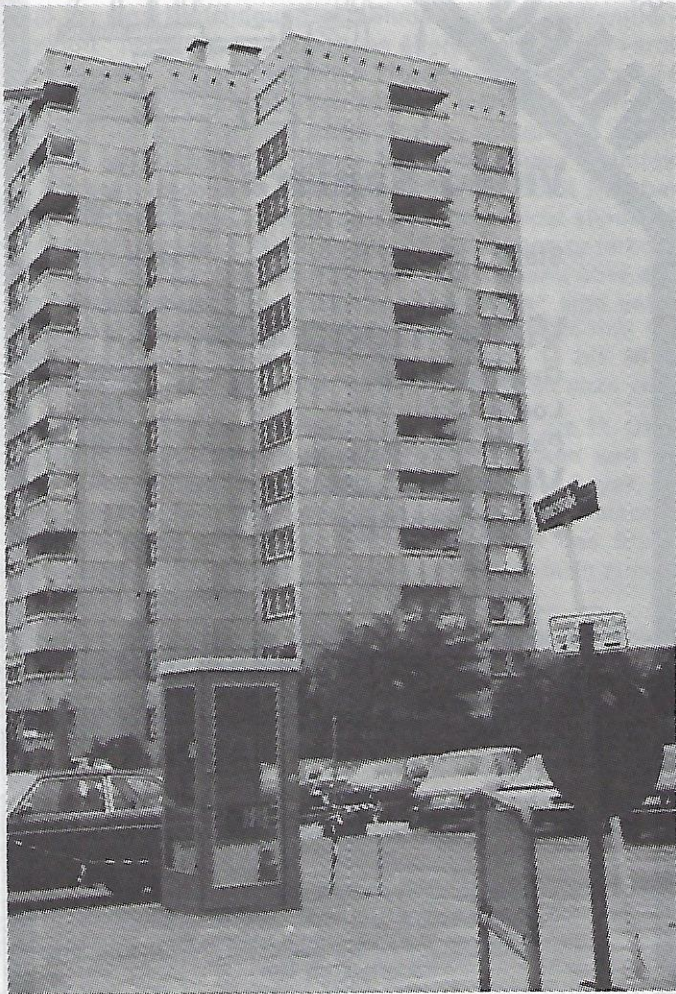
Das Bild zeigt die Apinusstraße in ihrer ganzen Länge oder besser Kürze mit dem einzigen Haus der Straße.

Diese kurze Stichstraße — eine Abzweigung der Wurfbeinstraße — erhielt im Jahre 1968 einen eigenen Namen (Beschluß des Bauausschusses vom 24. 6. 68, veröffentlicht im Amtsblatt Nr. 32 vom 7. 8. 68). Wegen der beabsichtigten Bebauung hielt man es für notwendig, diesem kleinen Teil der