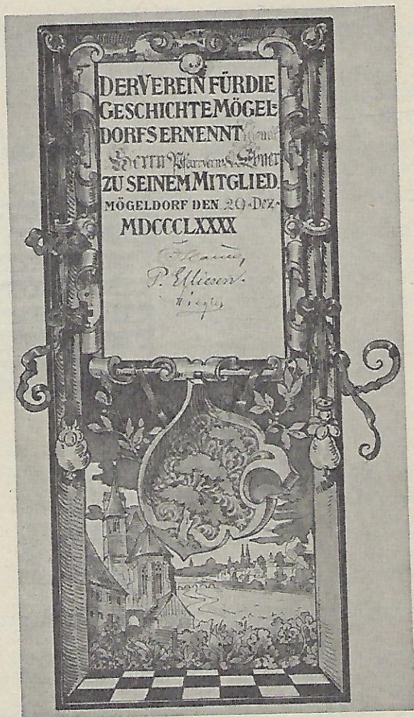
Künstlerische Mitgliedsurkunde aus 1890