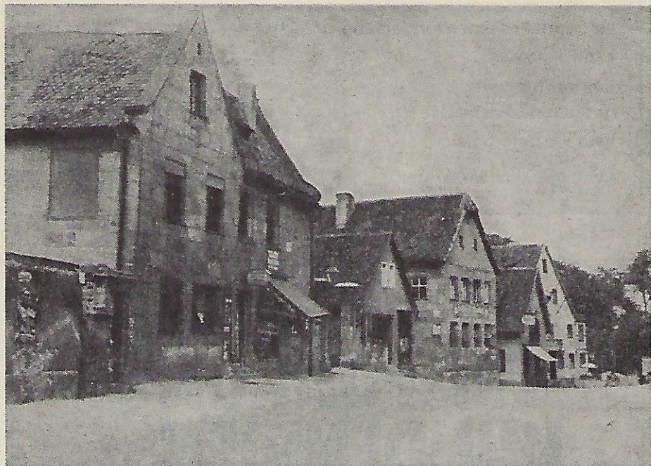
Mögeldorfer Hauptstraße um 1946