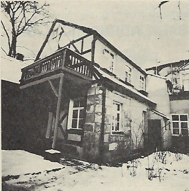
Haus Maier, Parkseite