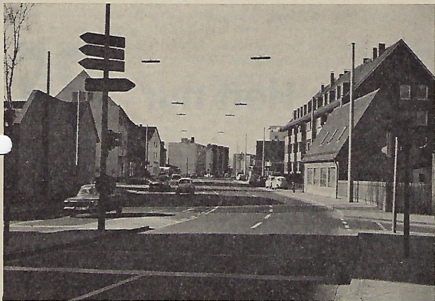
Ostendstraße 1975, früher Ortsstraße