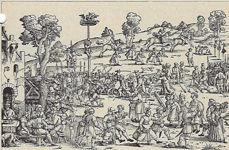
Kirchweih um 1535

Holzschnitt v. H. S. Beham (Germ. Nat. Museum)