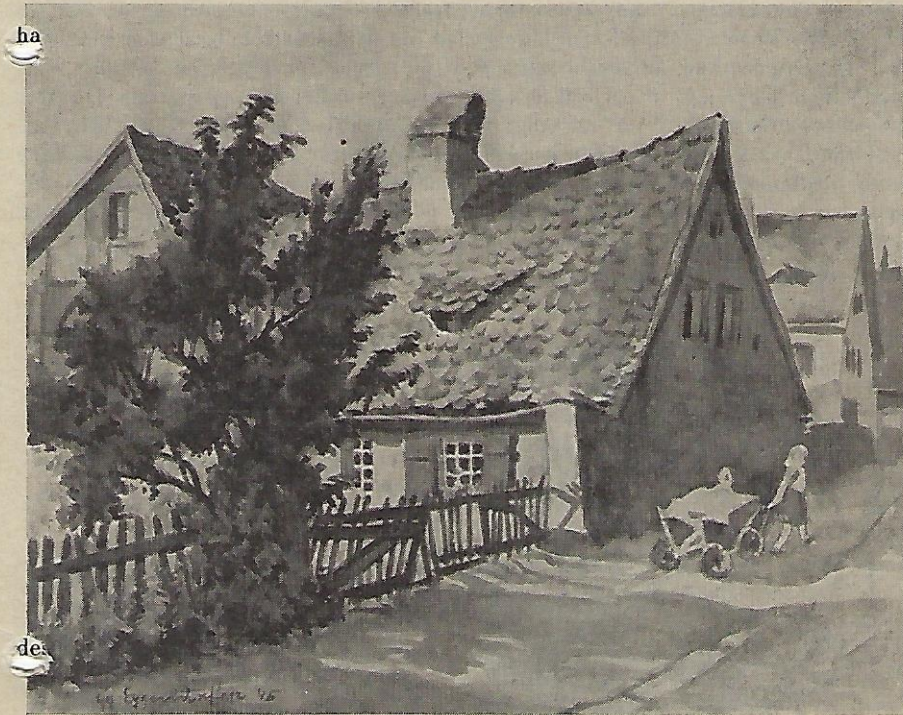
Der Taubershof in Mögeldorf

(nach einem Aquarell von Georg Eggendorfer, im Besitz von W. Meysel)