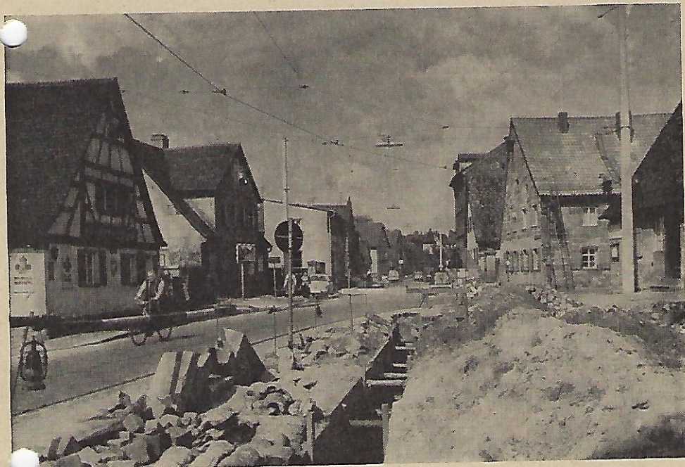
Die Mögelderfer Hauptstraße im Umbau