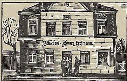
Haus vor dem Fliegerschaden