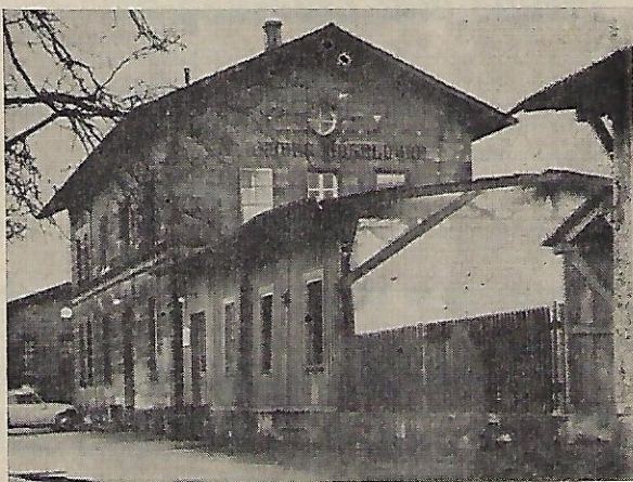
Bahnhof Mögeldorf bis 31. März 1959

Zur 100 Jahrfeier unserer alten Ostbahn haben wir Mögeldorfer den Wunsch, daß sie wieder zweigleisig ausgebaut werden möchte. Der BB-Direktion aber sei noch herzlich gedankt für die Verschönerungsarbeiten im Bereich des Bahnhofes.